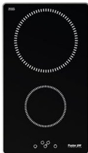
Table de cuisson Ognidove